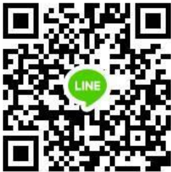
QR Code กลุ่ม Line