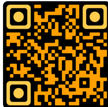
QR Code แบบฟอร์มการสมัคร