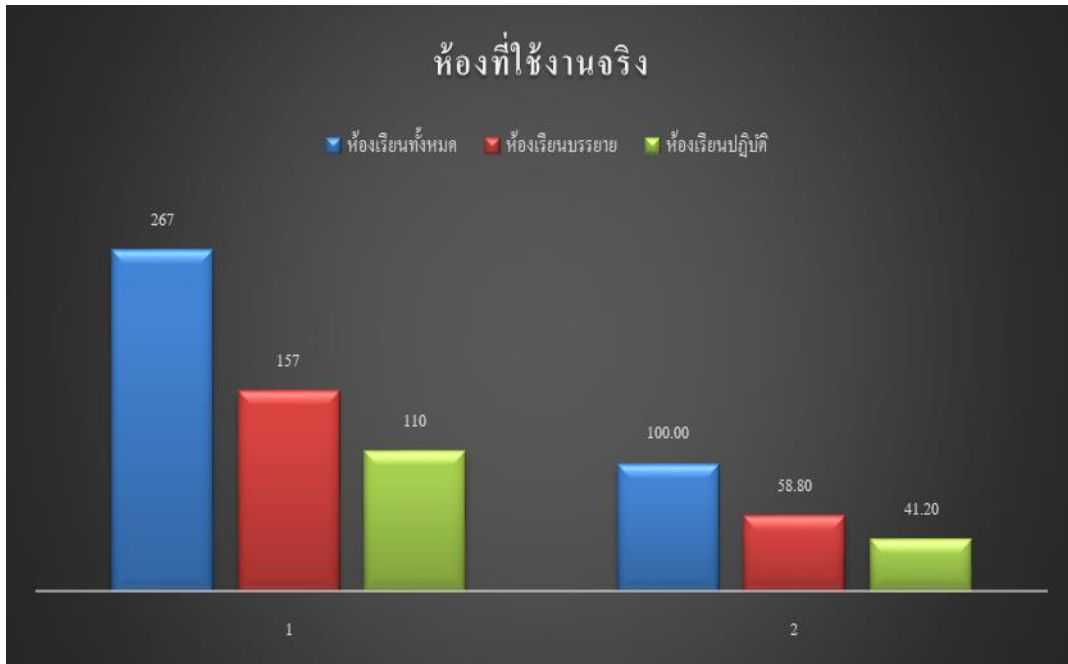
แผนภูมิที่ 3 แสดงร้อยละข้อมูลการใช้ห้องเรียนที่ใช้งานจริง