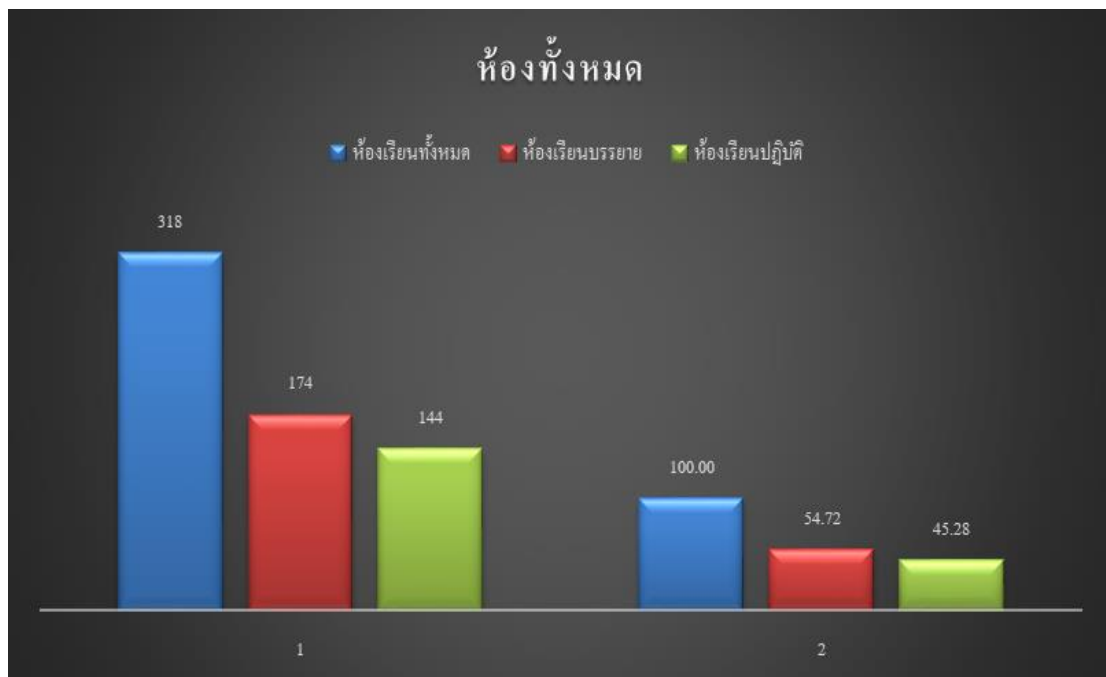
แผนภูมิที่ 2 แสดงร้อยละข้อมูลการใช้ห้องเรียนทั้งหมด

ข้อสังเกตเพิ่มเติมพบว่า บางส่วนงาน ได้แจ้งต่อกลุ่มภารกิจทะเบียนนิติและบริการ การศึกษานำห้องประชุม ห้องพักอาจารย์ และห้องบริการเพื่อการศึกษา มาใช้ในการจัดห้องเรียน ตามตารางการเรียนการสอนด้วย ได้แก่ คณะมนุษยศาสตร์และสังคมศาสตร์ มีการนำห้องประชุม และห้องพักอาจารย์ มาใช้เป็นห้องเรียนบรรยาย จำนวน 3 ห้อง คณะเศรษฐศาสตร์และบริหารธุรกิจ มีการนำห้องประชุมมาใช้เป็นห้องเรียนบรรยาย จำนวน 2 ห้อง คณะศิลปกรรมศาสตร์ มีการนำห้องประชุมและห้องพักอาจารย์มาใช้เป็นห้องเรียนบรรยาย จำนวน 2 ห้อง คณะวิทยาศาสตร์ มีการนำห้องพักอาจารย์มาใช้เป็นห้องเรียนบรรยาย จำนวน 1 ห้อง และคณะศึกษาศาสตร์ มีการนำห้องพักอาจารย์ และห้องบริการเพื่อการศึกษา มาใช้เป็นห้องเรียนบรรยาย จำนวน 2 ห้อง เนื่องจากห้องเรียนบรรยายมีไม่เพียงพอต่อการใช้งาน หรือไม่มีห้องเรียนบรรยายที่อยู่ในความดูแลของหน่วยงานเองเพื่อให้เกิดความสะดวกในการดำเนินการ รายละเอียดปรากฏดังตาราง 9