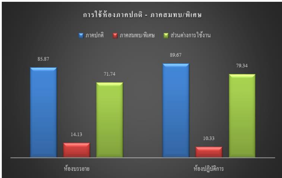
แผนภูมิที่ 4 แสดงร้อยละข้อมูลการใช้ห้องเรียนในภาคปกติ และภาคพิเศษ