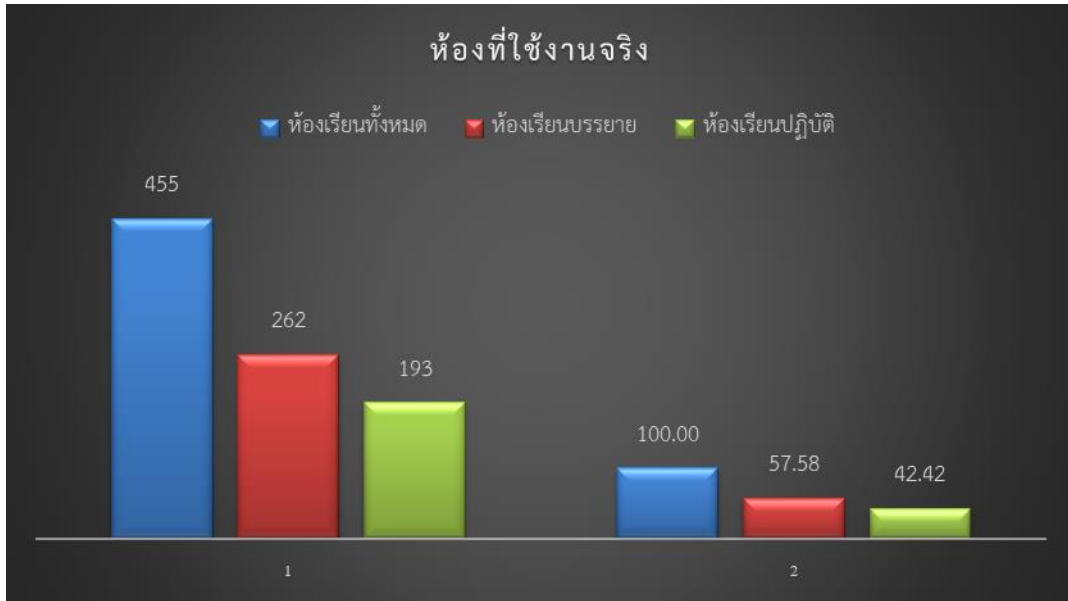
แผนภูมิที่ 3 แสดงร้อยละข้อมูลการใช้ห้องเรียนที่ใช้งานจริง