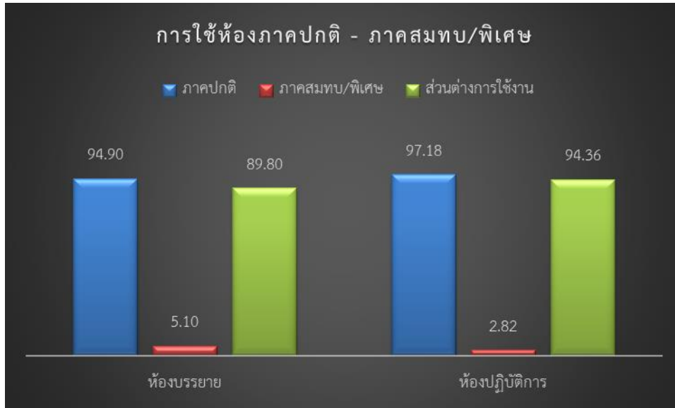
แผนภูมิที่ 4 แสดงร้อยละข้อมูลการใช้ห้องเรียนในภาคปกติ และภาคพิเศษ