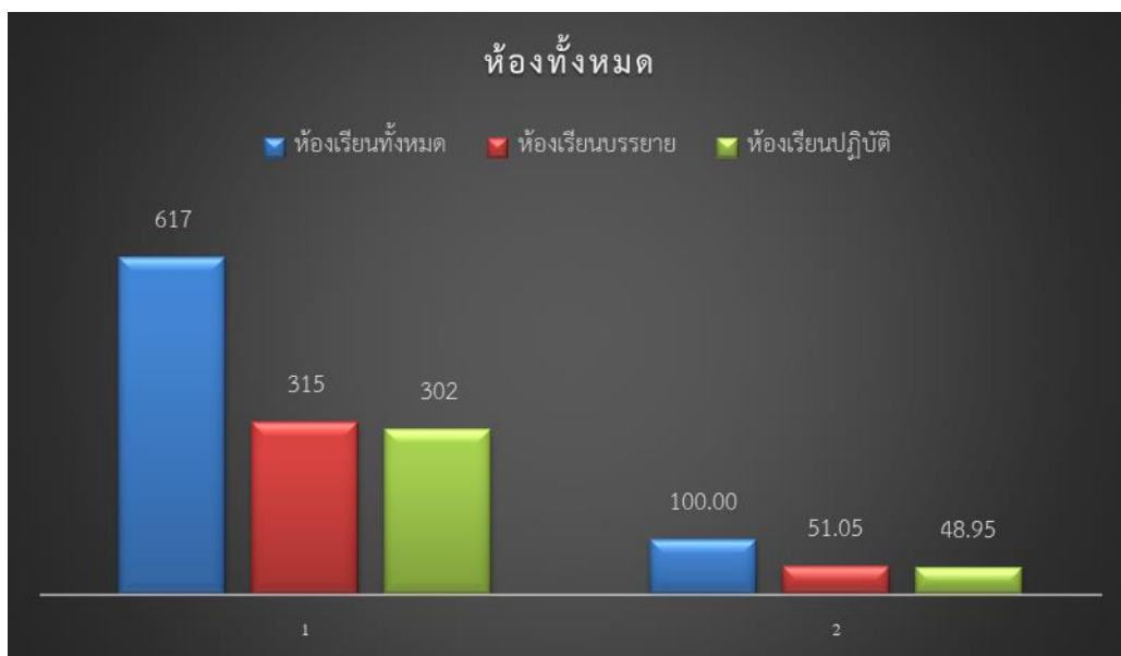
แผนภูมิที่ 2 แสดงร้อยละข้อมูลการใช้ห้องเรียนทั้งหมด

ข้อสังเกตเพิ่มเติมพบว่า บางส่วนงานได้แจ้งต่อกลุ่มภารกิจทะเบียนนิสิตและบริการการศึกษา นำห้องประชุม ห้องพักอาจารย์ และห้องบริการเพื่อการศึกษา มาใช้ในการจัดห้องเรียนตามตารางการเรียนการสอนด้วย ได้แก่ คณะมนุษยศาสตร์และสังคมศาสตร์ มีการนำห้องประชุมและห้องพักอาจารย์ มาใช้เป็นห้องเรียนบรรยาย จำนวน 3 ห้อง คณะเศรษฐศาสตร์และบริหารธุรกิจ มีการนำห้องประชุมมาใช้เป็นห้องเรียนบรรยาย จำนวน 2 ห้อง คณะวิทยาศาสตร์ มีการนำห้องพักอาจารย์มาใช้เป็นห้องเรียนบรรยาย จำนวน 1 ห้อง คณะศึกษาศาสตร์ มีการนำห้องพักอาจารย์ และห้องบริการเพื่อการศึกษา มาใช้เป็นห้องเรียนบรรยาย จำนวน 2 ห้อง และคณะนิติศาสตร์ มีการนำห้องประชุมมาใช้เป็นห้องเรียนบรรยาย จำนวน 2 ห้อง เนื่องจากห้องเรียนบรรยายมีไม่เพียงพอต่อการใช้งาน หรือไม่มีห้องเรียนบรรยายที่อยู่ในความดูแลของหน่วยงานเองเพื่อให้เกิดความสะดวกในการดำเนินการ