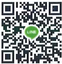
QR Code สำหรับยื่นเรื่องสอบ