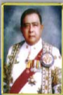
ศาสตราจารย์เกียรติคุณ ยศมิตถ ธรรมสโรช