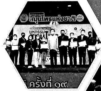
ครั้งที่ ๑๙