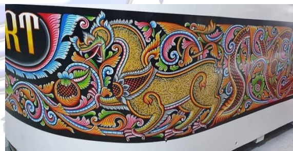
สัตว์หิมพานต์ประเภท สิงห์

wants to