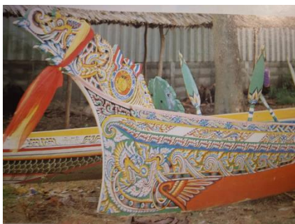
สัตว์หิมพานต์ประเภตนาค

wants to