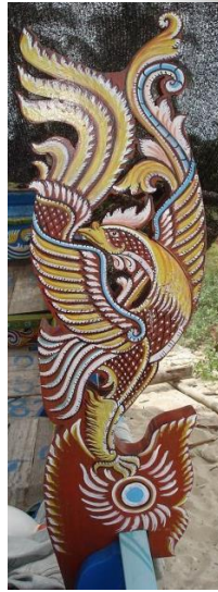
ส่วนประกอบขอเรือกอและ(มุขะ) ไม้ฉลุลงสี รูปนกกาเหาะชुरอ หรือนกกาเกสุระ