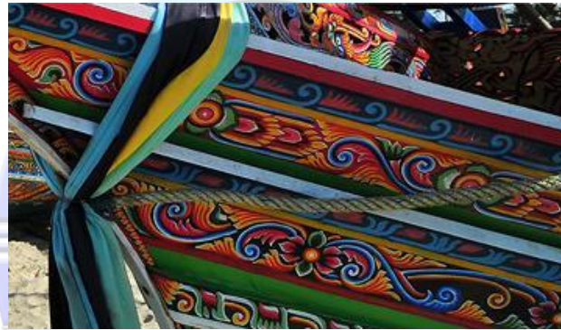
ภาพลวดลายประดับเรือกอและ ที่ประดับตกแต่งด้วยจิตรกรรม ด้วยลายไทย ลายประจำยาม ลายพุกกษาพรณไม้ และลายน่องสิงห์

ดังนั้นจะเห็นได้ว่าลวดลายต่างที่นำมาใช้ตกแต่งบนเรือกอและนั้น ส่วนใหญ่ก็เป็นลายพื้นฐานที่มาจากลวดลายไทยแทบทั้งสิ้น ลวดลายที่ใช้ตกแต่ง ได้แก่ ลายกระจัง ลายดอกพุดตาน ลายประจำยาม ลายหน้ากระดาน ลายรักร้อย ลายก้านขด ลายกนก 3 ตัว ลายกนกบัวคว่ำบัวหงาย ลายน่องสิงห์ หรือลายแข่งสิงห์ ลายนกคาบ และลวดลายจีน เช่น ลายหน้ากระดาน ลายเรขาคณิต ลายพรณไม้ และมีที่แตกต่างออกไปบ้าง ของช่างเขียนลายที่นับถือศาสนาอิสลามที่จะต้องหลีกเลี่ยงการสร้างสรรค์ เกี่ยวพันกับรูปร่างของมนุษย์ เพราะเกรงว่าเป็นการเลียนแบบพระผู้เป็นเจ้า แต่รูปแบบก็ยังเป็นลวดลายแบบลายไทยที่มีลักษณะโดดเด่น และทรงคุณค่า ควรแก่การอนุรักษ์และสืบสานต่อไป