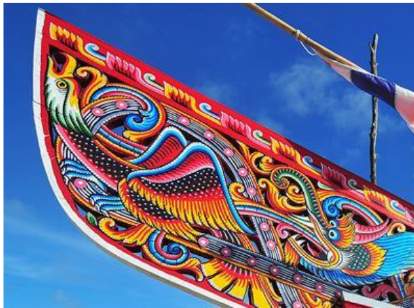
ภาพลวดลายประดับเรือก้อและ เขียนเป็นรูปสัตว์ในจินตนาการจาก รูปนกสัตว์จากประเพณี