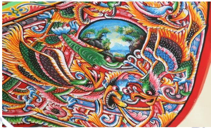
ภาพลวดลายประดับเรือก้อและ เขียนเป็นรูปสัตว์ในจินตนาการจากสัตว์จากประเพณี และสัตว์น้ำ ผสมผสานกับกับภาพทิวทัศน์ โดยช่างเขียนได้นำมาจัดองค์ประกอบได้อย่างลงตัวและสวยงาม