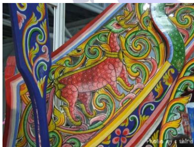
สัตว์หิมพานต์ประเภท สิงห์