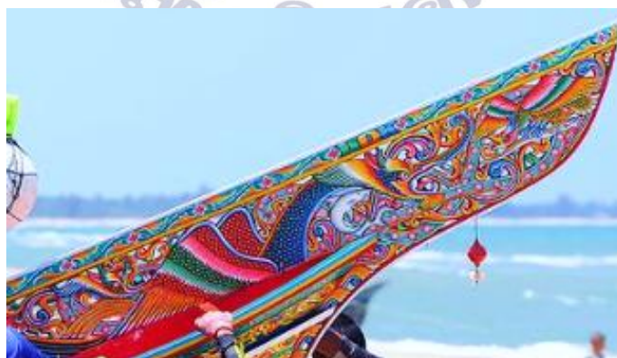
ภาพลวดลายประดับเรือก้อและภาพลวดลายประดับเรือก้อและ เขียนเป็นรูปสัตว์ในจินตนาการจาก รูปนกสัตว์จากประเพณี