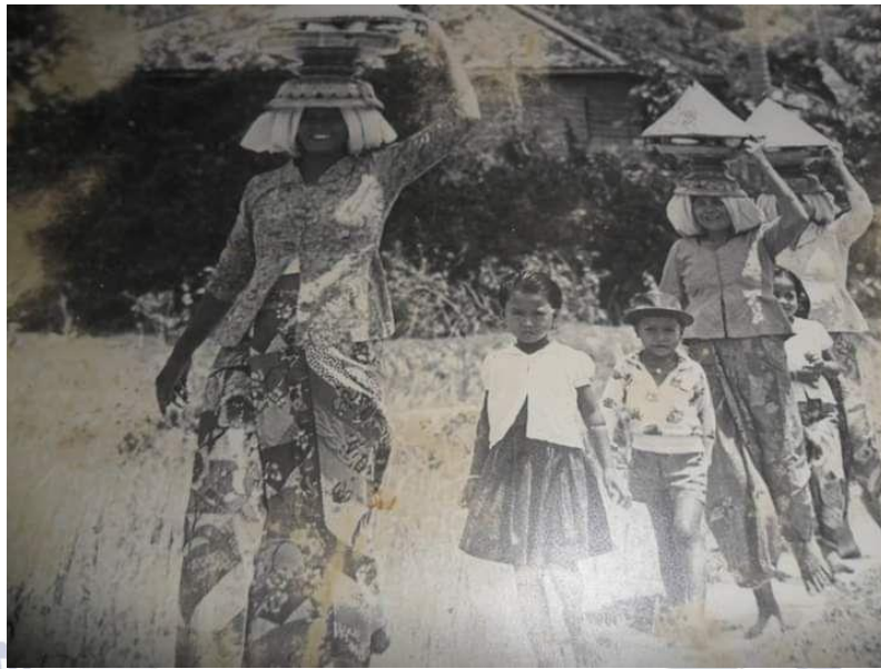
ประเพณีโบราณ ทุนพานสำรับอาหารชาวไทยมุสลิม

นอกจากวันรายาแล้วนั้น ที่ชุมชนบ้านดอนขี้เหล็กยังมีการทุนพานยกสำรับในงานบุญประเพณีอื่นๆ อีกด้วย ซึ่งคนทั้งหมู่บ้านทำร่วมกัน คือ บุญกุโบร์ บุญมูลอด (ทำบุญวันเกิดนปี) กิจกรรม "เมาลีต้นนาปี" รำลึกถึงท่าน ศาสตามูฮัมหมัด (ช.ล.) ณ มัสยิดบ้านดอนขี้เหล็ก (ในบ้านใหญ่) หมู่ที่ 5 ตำบลพะวง อำเภอเมืองสงขลา จังหวัด สงขลา