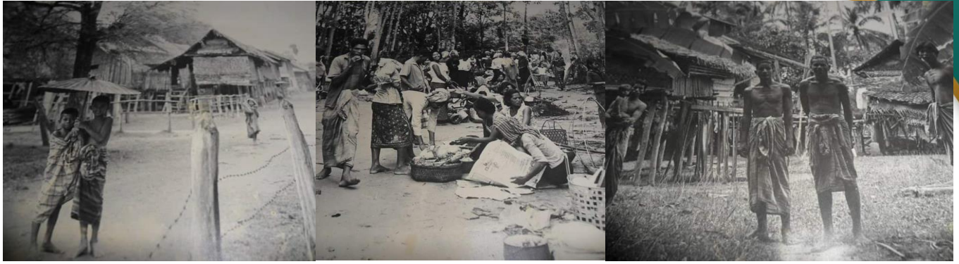
ที่มาภาพ: เพลง ที่หมู่บ้านดอนขี้เหล็ก อดีตวิถีชุมชนบ้านดอนขี้เหล็ก บันทึกเมื่อ 60 ปีที่ผ่านมา