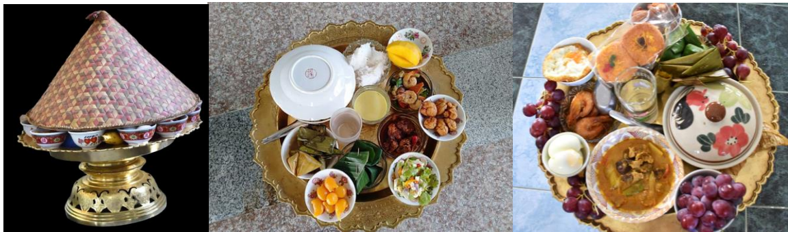
วัฒนธรรมการใช้พานทองเหลืองเพื่อจัดสำหรับอาหารเพื่อใช้ในพิธีกรรมสำคัญทางศาสนาอิสลาม ชุมชนมุสลิมบ้านดอนขี้เหล็ก ตำบลพะวง อำเภอเมือง จังหวัดสงขลา