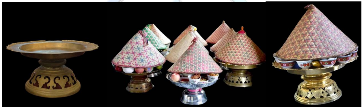
ภาพรูปแบบการใช้ประโยชน์จากพานทองเหลืองในพิธีกรรมทางศาสนาของอิสลาม

พานเป็นภาชนะใช้สำหรับรองรับสิ่งของที่มีความสำคัญ เนื่องจากของที่วางบนพานนั้นจะให้ความรู้สึกในทาง เชิดชู และเทิดทูน คุณมีคุณค่าแก่ผู้รับหรือผู้ใช้ เป็นภาชนะที่มีความสำคัญมากสำหรับใช้ในงานบุญหรืองานพิธีกรรม ทางศาสนา ผ่านเป็นภาชนะที่คนไทยออกแบบและสั่งทำเพื่อการใช้สอยเองโดยเฉพาะ เช่น ใช้พานเป็นภาชนะใส่ ดอกไม้ถวายพระ ใช้จัดดอกไม้ไหว้ครู ใช้จัดเป็นพานใส่หมากพลู ใช้ใส่บุหรี่ยาสูบสำหรับแขกที่มาร่วมงาน และ ใช้จัดเป็นสำรับอาหาร เป็นต้น